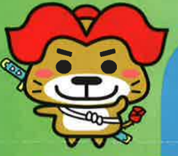
可児キャラ「バラ丸まる」