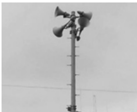
必要な情報と市民をつなぐ防災行政無線