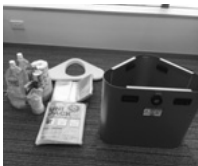
土岐市役所の非常用エレベーターチェア

A 本市は、各事業の予算や条件に合わせて債務負担行為、ゼロ市債や繰越といった各種制度を、契約担当の他発注担当、財政担当と連携を密にし、議決事項は議会に諮りながら適切に活用している。