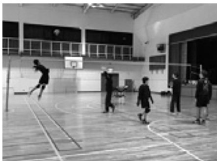
兼山小学校で練習する中部中の保護者クラブ

設開放事業によって体育館やグラウンドを使うほか、自校の体育施設等を使う場合がある。また、地区センターなど学校以外の施設も利用している。部活動の休養日が増えるなど、ジュニア期のスポーツ活動の環境が従来とは変わってきているので、部活動に準じる保護者クラブの活動については、市の施設をより利用しやすくするようにできないかを早期に検討していく。