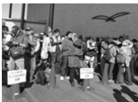
山城サミットでシャトルバスの列に並ぶ人々

A 子育て健康プラザ マーノはいつときの緊急避難的な避難所として活用できると考える。