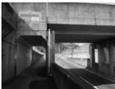
市道50号線のアンダーパス

A 参加していない進学校には今回作成した企業ガイドブックを届け、取り組みを説明している。