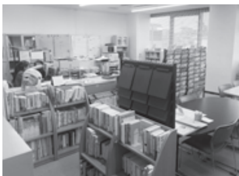
市総会館2階の「かにNPOセンター」

Q 「移住人口」でもなく「交流人口」でもない、本市に関心を寄せたり頻繁に訪れる人を「関係人口」と呼ぶが、どのように増やしていくか。