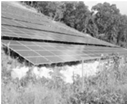
課題の多い小規模太陽光発電設備

A 協議対象面積を引き下げても、新たに対象となる発電設備の設置を止められないが、地域住民に事業内容を事前に知らせることができると、また、事務手続きが増えることで一定の抑止効果が期待できるため、対象面積の引き下げを検討する。設置場所は、公表データをもとに現地確認を行い、GIS上に整理し、庁内でも共有する。ハザードマップ等との照合に活用していく。