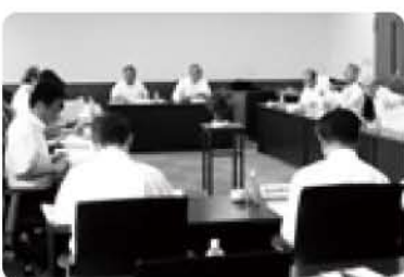
民生児童委員との意見交換会

6月16日には、民生児童委員連絡協議会役員と意見交換を行いました。長く継続していただける委員の発掘が課題とのことです。