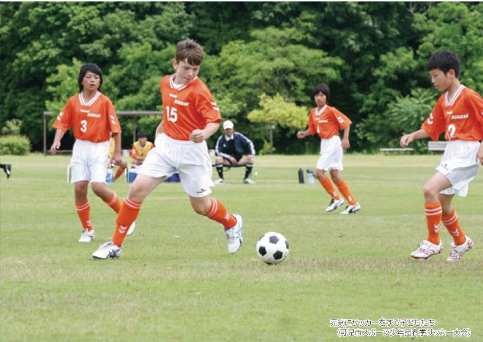
元気にサッカーをする子どもたち (可児市スポーツ少年団春季サッカー大会)