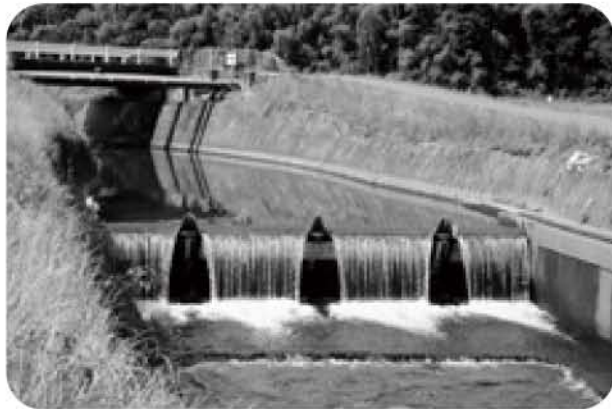
農業用水用頭首工(塩)

問 全国知事会をはじめ地方公共6団体は、財政の悪化を理由に国の直轄事業に対する負担金の軽減・廃止を求めている。県に対しても負担金の軽減・廃止を求めなければならない。本市においても受益者負担金を徴収しているが見直し・廃止を検討すべきである。市長 これまでも受益者負担金の低減をしてきた。後継者不足から農家戸数が減少し、農業用施設整備に係る受益者負担金は重荷になっている。