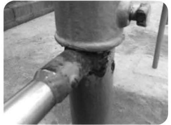
傷みが進む小学校の鉄棒

問 大不況の中、市民生活、中小企業の経営が深刻だ。国の地域活性化・経済危機対策臨時交付金など、国の補正予算施策を生かし、雇用確保と商工業者への消費拡大対策を質す。 総務部長 この交付金の活用案を9月補正までに間に合わせ予定だ。