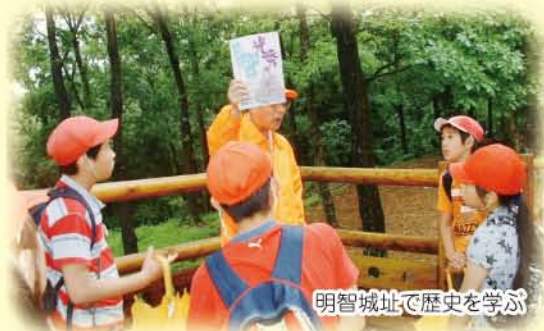
明智城址で歴史を学ぶ