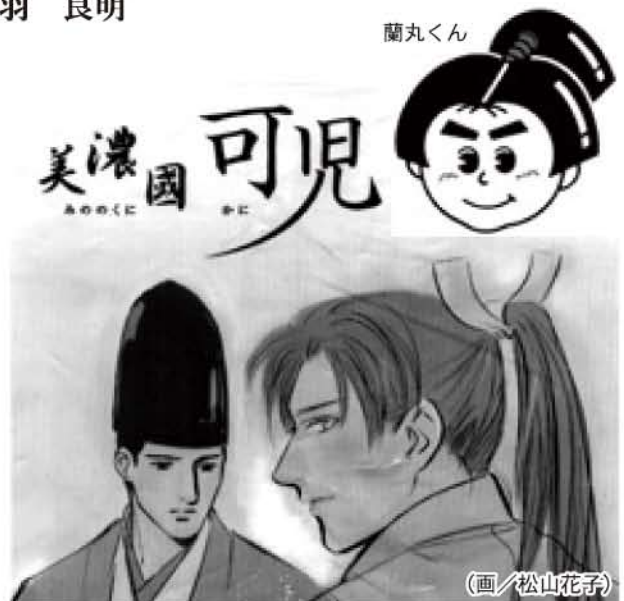
こんなパッケージはいかがでしょう