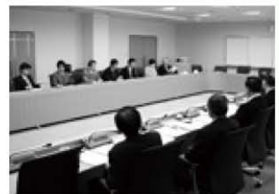
駒ヶ根市との意見交換