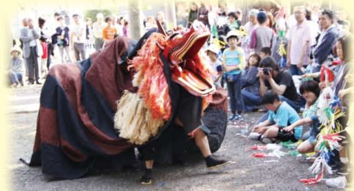
獅子舞に子どもがびっくり