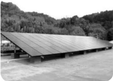
兼山小学校屋上の太陽電池パネル

問 県道の道路改良事業促進の意欲は。 建設部長 毎年可茂土木事務所と行政懇談会の場を持ち、鋭意推進要望をしているが、財政難の折り当面維持管理を徹底し、住民の安全管理に万全を期したい。 問 本市の道路行政の将来展望は。 市長 道路の問題は本市行政の中でも大変難しい状況に入ってきた。今後一層、国関係機関に対し、全力で働きかけていく。