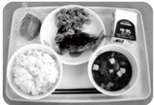
学校給食センターで、安全でおいしい給食を

「安全・安心で、子どもたちの待つ時間までにおいしい給食を届ける」という観点からも、今後も現状でいきたい。