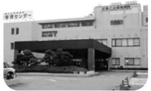
地域医療の中核を成す岐阜社会保険病院

問 発達障がい児が増加している。学齢期における学校現場を中心とした支援体制は機能しているか。 教育長 各小中学校に配置されている特別支援教育コーディネーターを中心に、スクールサポーターや児童クラブ職員に至るまで、研修制度を充実させ、早期発見・早期療育に努めている。 その他の一般質問 デマンドバスの今後の展開は