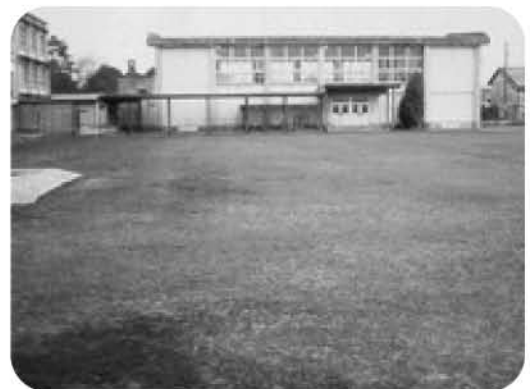
鳥取県境港市誠道小学校の芝生

初期費用や維持管理費用が安く、維持管理作業も簡単な芝を使用して成功している例を認識している。植え付け・維持管理を子どもや保護者、地域ボランティアで行えばエデュース9の精神に通ずる。桜ヶ丘小学校をモデルケースとして他の小・中学校にも校庭の芝生化が広がり、これを契機に地域コミュニティの醸成が図られるよう取り組みたい。