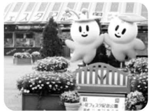
花フェスタ記念公園を守る手だては

問 岐阜県によると、公園を運営する財団との特定者指名を公募に移行し、事業の縮小と見直しを進めているが、今後の公園の方向性は。また市としての公園の位置付けは。