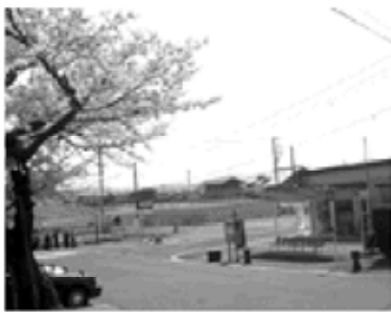
駅側から見た事業地内

◇平成19年度可児市可児駅東土地区画整理事業特別会計予算 質疑 歳入の仮設住居使用料2550万円はどんなものか。