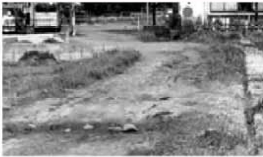
未舗装公道(土田栄町内)

問 維持管理課の職員がリストラされる以前では、赤道などの簡便な補修工事は市が機動的に対処し改善してきた。最近では、工事材料を支給するというが、棚ざらし状態である。シルバー人材センターなどを活用し自治会が承知した道は、市が簡易舗装を行って解決をせよ。