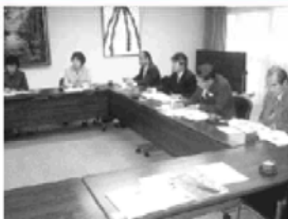
「太陽の家」で説明を受ける委員

も園)を目指していた。特区申請によるこの制度は、今後広がるものと予想されている。また、同町は夢の大吊橋で一躍有名になり、経済効果を上げている。 別府市では、社会福祉法人「太陽の家」を視察、企業との協働が、障がい者の勤労場所の確保につながる実感した。 豊後高田市では、まちおこしの実態を目の当たりにした。地域住民がそれぞれ分担し合い、この地を訪れる人々に対応しており、その努力を垣間見ることができた。