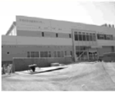
2学期から新センターで調理業務を開始