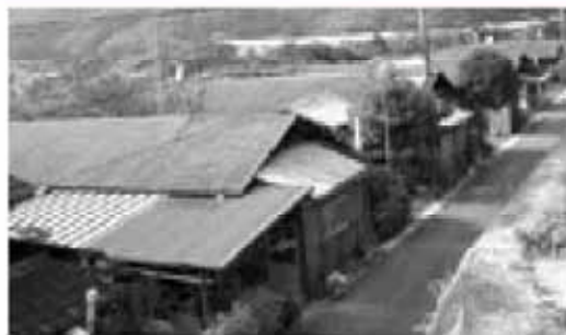
早期の対応が望まれる市営住宅(兼山地区)

問 今、日本の社会が進む少子・高齢化の中で、とりわけ地域の人口動態は気掛かりである。兼山地域にある築後40年余りの既設市営住宅の扱いをどう考えるか。 また、市民が買いたいと思える市有地の公売計画はあるか。