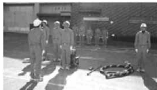
坂祝中学校の少年消防クラブ