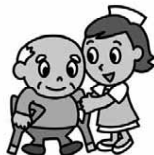
早く元気になってね

今後、看護師不足問題は、医療体制の整備に係る医師会との協議の中で検討していきたい。