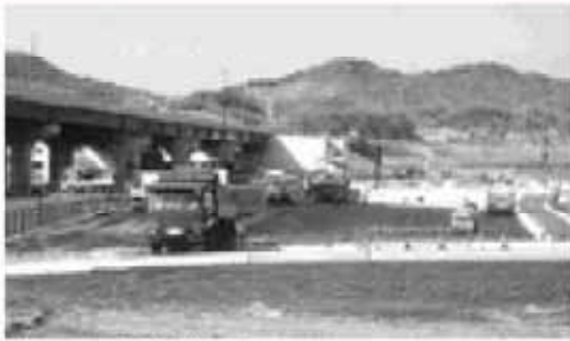
道の駅駐車場整備工事