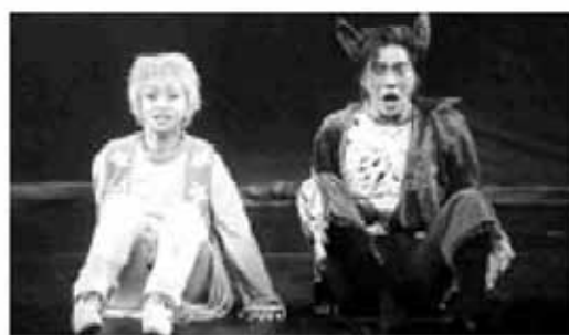
子どものためのミュージカル「リトルプリンス」

良質な芸術を鑑賞することは、園児、児童・生徒の成長にとつて大切であるが、アールでの芸術鑑賞は、今のところ考えていない。現在、小学校では学校内で、音楽や演劇の鑑賞会を開催しており、参加型の演劇や音楽会は、学校ごとで行った方が効果的ではないか。また小・中音楽会では、市内全小学校の4年生がアール大ホールの舞台に立っている。