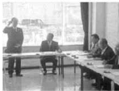
川俣町議長から説明を受ける委員

これらを実施した結果、町内児童・生徒の学力が向上し、学区を越えた交流も盛んになったとの話を受け、本市においても大いに参考とし、前向きに取り組んでいきたいと考えた。