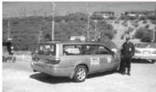
桜ヶ丘安全パトロール隊

問 青色回転灯パトロール活動を各地区にて実施していただくため「地域の防犯は自分たちで守る」をスローガンに立ち上がり、活動中の桜ヶ丘安全パトロール隊に支援してほしい。今後、活動を検討している各自治連の実施に対する後押し、パトロール隊の結成に向けての支援を望む。