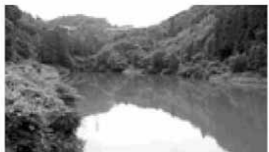
3年前に重金属が流れ込んだ新滝ヶ洞池

私も、大学教授のシミュレーションを使った実験で安全というデータが得られて、それ以上拡散しないことを信用している。