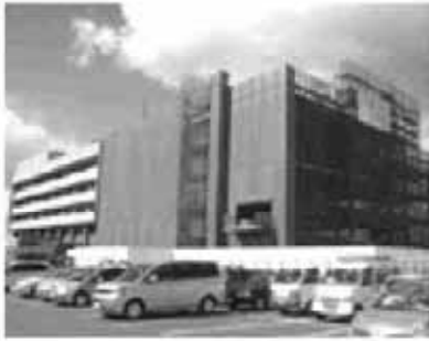
耐震・増築工事が進む市役所庁舎