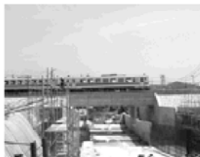
着々と整備が進む跨道橋