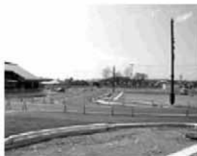
整備が進む可児駅東地域