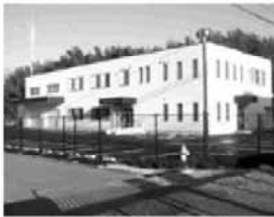
新設された水道部分庁舎(川合)