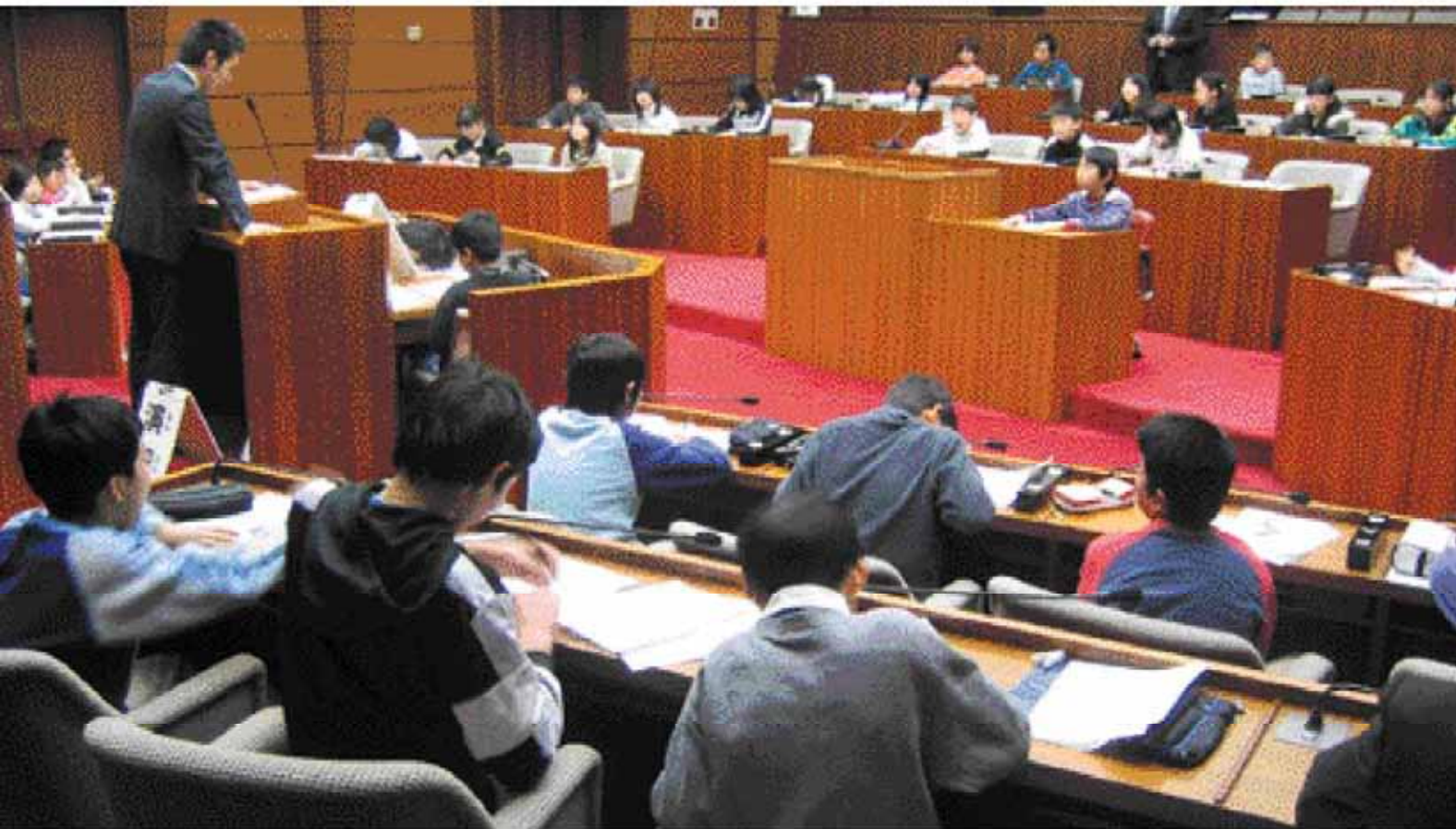
2月に行われた桜ヶ丘小学校子ども議会