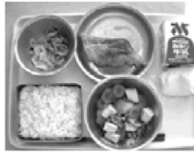
小学校230円、中学校260円(一食当たり)

質疑 給食費滞納問題の解決策として、就学援助費を受けていてもなお滞納がある家庭からは給食費を先にいただく。または、全体的に先払い制を導入するなど策はできないのか。