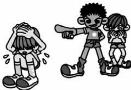
いじめの方が絶対悪い!

問 また、情報の共有に関しては、非常に大事なことで、その後の経過を含め十分に進めていきたい。