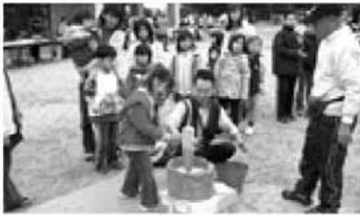
地域での活躍を期待