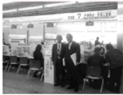
茨城県ひたちなか市の総合窓口

総合窓口は1階フロアのカウンターをすべて取り替え、一部を除きローカウンターにし、上部には案内表示が設置され、非常に分かりやすく見やすかった。