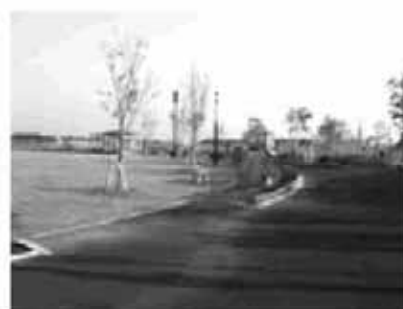
防災機能を持つ近隣公園(君津中央公園)

急時照明灯等を備えた公園で約10億円をかけて整備中である。本市でも市街地の避難所として参考になった。