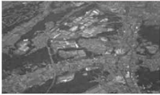
可児工業団地と南部開発

問 東海環状自動車道東回りルートの開通に伴い周辺自治体への工場進出が進んでいる。本市でも安心して働き住み続けるために優良企業を根付かせ、育成することが肝要である。土地の有効活用と誘致のため、より一層の優遇措置を講ずる必要があるが施策はあるか。