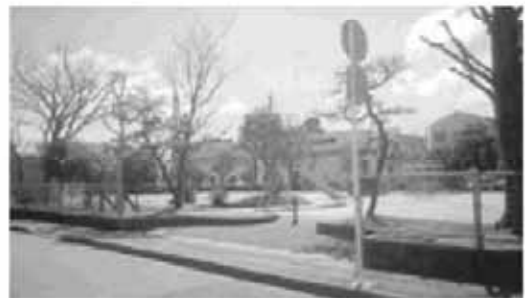
見通しのよい広見第一児童公園

1点目は、市独自の出産費用立て替え制度はないが、国保加入世帯への制度としては県国保連合会の24万円を上限とした出産費資金貸付共同事業がある。今後、この制度の周知を図り、必要な方を利用してほしい。2点目は、市として再三病院側へ存続を強く要望してきたが、今回の事態は全国的な医師不足が原因と考えられる。