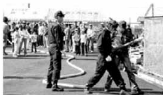
地域に必要なとされる消防団

答 国の方針で医療技術の高度化、専門化に伴い医療機関の機能分化が進められており、岐阜社会保険病院では急性期で比較的症状の重い患者に適切な医療を提供した後、治療過程において適正なかかりつけ医やほかの医療機関へ紹介し、対応している。今後も引き続き中核病院としての位置づけでの役割を果たしていただきたい。