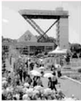
より一層の可見市のイメージアップ、特産物研究を！