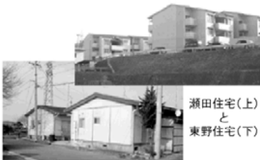
瀬田住宅(上) と 東野住宅(下)

住宅管理条例で42平方メートル以下の住宅と定められており、東野住宅しかない。東野住宅を有効利用できるなら、今後広眺ヶ丘や瀬田のような比較的大きい市営住宅には家族でお住まいの方に入居していただき、一人でお住まいの方には、東野住宅のような平屋の、バリアフリーを施したところに替わっていただき、多くの入居希望者が有効に利用していただけるように考えていきたい。