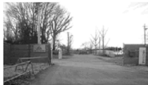
二野工業団地予定地

可児市・旧兼山町との合併から一年が経ちました。今回は、議会に寄せられた兼山にお住まいの方の声をお届けします。