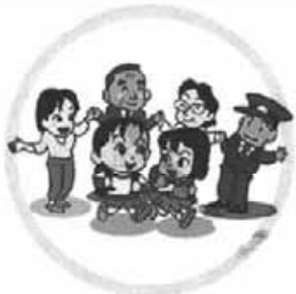
子どもの安心は点から線へ

問 「さつきバス」が発足して5年になる。家から一歩出て春と秋の里山の散策は、心身ともリフレッシュでき健康にもよい。可児のよさは、沢山ある。乗り物で周遊できれば、もっと楽しむことができる。春と秋の期間だけでも格安の「さつきバス」周遊券の発行をしたらどうか。