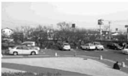
文化創造センター駐車場予定地の栗畑