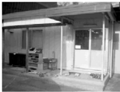
多くの子どもたちが利用する児童クラブ

備のため、校長会などで協議を進めた。様々な心配や課題もあったが、現在も協力や連携はとられており、今回教育委員会に移行されたことでさらに強い連携が取られると思っている。対象者を拡大する計画については、こども課が進めている。次世代育成支援行動計画の中で、4年生から6年生までについては民営化という方針に基づいて検討されることになっている。