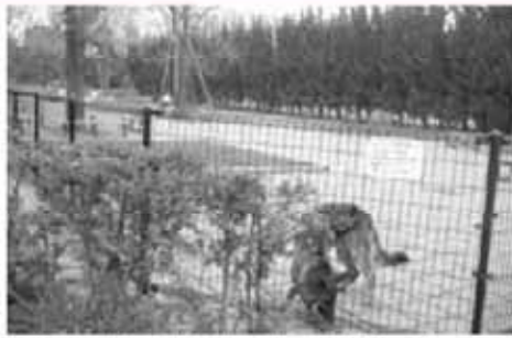
東京世田谷・駒沢公園内の公設ドッグ・ラン