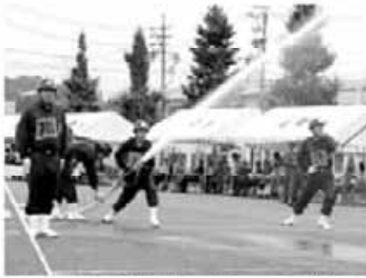
年々、団員の確保が難しくなっている消防団

総務部長 できるだけ地域の方々に消防団の重要性を理解してもらえよう、地域全体にPRをしていきたい。また、幹部の人たちと相談しながら、団員になるべく負担が掛からないように環境の改善を図っていく